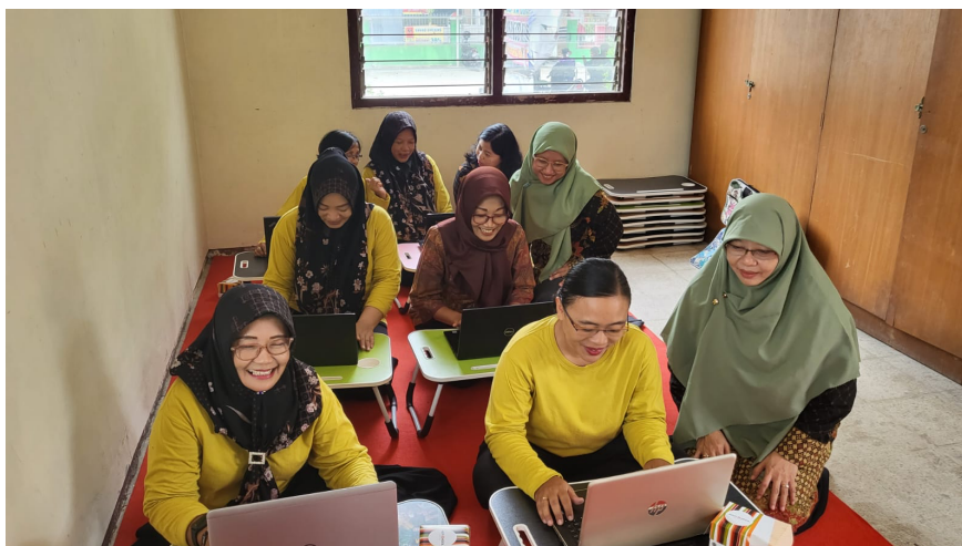
Gambar 1. Pendampingan Peserta

Guru berhasil menggunakan sistem presensi digital yang mempermudah pencatatan kehadiran siswa secara real-time. Sistem ini juga memudahkan rekapitulasi data kehadiran bulanan tanpa proses manual. Pelatihan penggunaan sistem presensi digital berbasis Google Form, Google Sheet, atau aplikasi sederhana lain yang mudah dioperasikan oleh guru PAUD. Peserta diberikan penjelasan mengenai cara membuat format absensi online, cara mengisi, melihat rekap otomatis, hingga cara mengunduh data kehadiran bulanan. Pelatihan ini dilakukan secara praktik langsung sehingga guru dapat mencoba membuat dan menggunakan absensi digital sesuai kebutuhan kelas masing-masing. Pendampingan diberikan secara bertahap hingga seluruh peserta mampu menggunakan sistem presensi digital secara mandiri, kegiatan pendampingan seperti pada Gambar 1.