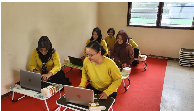
Gambar 2. Pelatihan Literasi Digital

Pelatihan literasi digital diberikan untuk meningkatkan pemahaman guru dalam mengoperasikan perangkat teknologi secara baik dan aman. Materi pelatihan meliputi pengenalan penggunaan laptop dan perangkat online, manajemen penyimpanan dokumen daring (Google Drive atau platform lain), serta penerapan keamanan data dasar seperti pengaturan akses dan perlindungan file. Guru juga diberikan latihan untuk mengunggah, mengedit, dan membagikan dokumen secara kolaboratif. Dengan adanya pelatihan literasi digital ini, guru diharapkan mampu meningkatkan efisiensi kerja serta memanfaatkan teknologi secara optimal dalam pengelolaan administrasi PAUD. Guru mengalami peningkatan pemahaman terkait penggunaan aplikasi administrasi digital, manajemen file, dan keamanan data. Guru mampu mengoperasikan sistem secara mandiri setelah pendampingan. Kegiatan Pelatihan literasi digital Guru seperti pada Gambar 2 berikut :